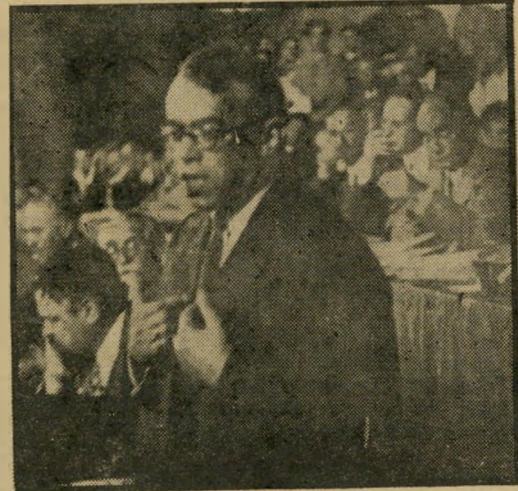
ידיים על החזה: ז'בוטינסקי נואם