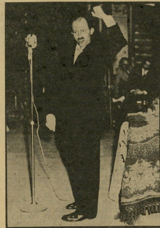
ידיים בתנועה: בגין נואם (1949)

גלהבים מבני השכונות הצטרפו אליהם, וכך נוצרה שיירה גדולה של אופנועים רועשים, שנסעה לפני בגין. התמונה של "מסע האופנועים" עוררה אסוציאציות עם מנהיגים פאשיסטיים, ותרמה למפלת חרות בבחירות אלה (שבהם עלה מ-15 ל-17 מנדטים בלבד).