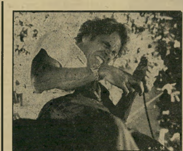
ברוס דרן — מטורף בשירות המחבלים

למשל, בפלישה למחנה המחבלים בלבנון או במירוף אחר מחבל חמוש ברחובות מיאמי. וזה מגיע לידי אקרובטיקה של ממש כאשר, בשיא הסרט, תלוי הניבור על מעטפת בלון המתנשא באוויר בגובה רב. כל זה עשוי במיקצועיות חלקה ובטוחה עד כדי כך שלפחות בעת הצגת הסרט אין הצופה מוטרד על-ידי ה"אמינות. הוא מרותק לכיסאו ונושך את שפתיו. וזה בהח" לט הישג שאסור לזלזל בו.