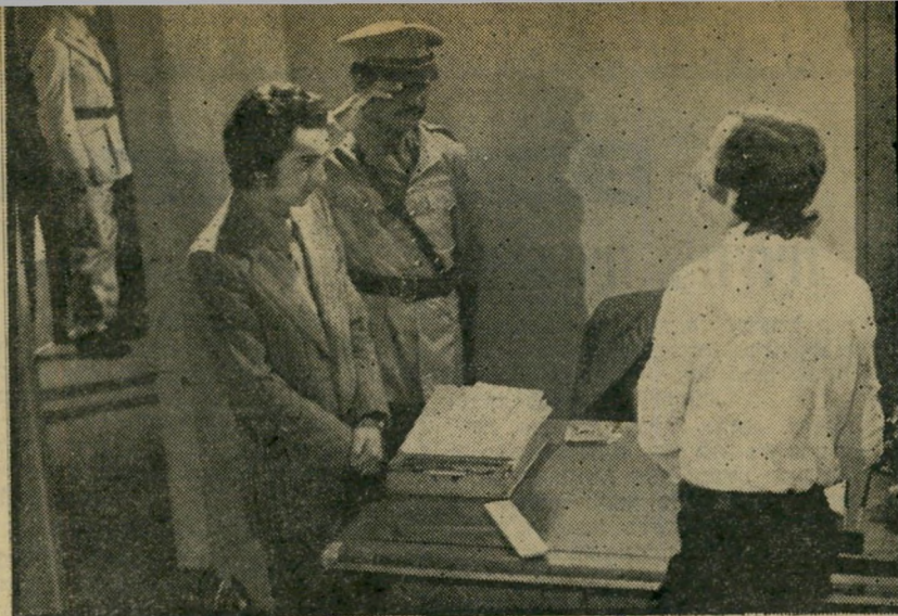
תמונה מהסרט הסורי "מר קירמה" במיטרה הכל בסדר

צתם הופיעה אפשר להזכיר את סטיב מקווין (בוליוט), ריאן או'ניל (הגנב שבא לסעוד), סרנס סינטרה (הבלש), ועוד די רשימה ארוכה. אבל אם מישור נזכר היום בכלל בסרטים אלה, הרי זה בגלל התפקידים הגבריים שבהם, ולא בגללה. מדוע? פשוט מאד. לז'אקלין ביסט יש כישרון נדיר לקבל כל תפקיד שמוצע לה, כמעט ללא הבחנה. הסכמתי פעמים רבות בעבר לגלם נשים שאינן יותר מן קישוט, מעין חפץ שניצב ומצטרף לכלל התפאורה של הסרט, היא מודה היום. העובדה שלא יכלה לומר "לא" להצעות המפיקים, לא השתקפה כלל בחייה הפרטיים, ואולי גם בכך היה כדי להכשיל את התקדמותה בעולם הבד. להבדיל מן הכוכבת המצויה שמשתמשת בגופה לא רק מול המצלמה, ז'אקלין ביסט מתעקשת להיות מונגאמיסטית מושבעת, ואם כי אינה מאמינה במוסד הנישואין (אני או' הבת ילדים אבל איני משוגעת לתינוקות, ומלבד הבאת תינוקות לעולם איני רואה סיבה להתחתן), היא חיה בכל פעם עם גבר אחד בלבד, וקשרים אלה נמשכים בדרך-כלל זמן רב. פעם זה היה שחקן הקולנוע הקנדי מייקל סאראזין, שאותו הכירה בהסרטה סיפור אהבה לקצב הבוסני נובה בשם הרכיבה המתוקה ועימו חיתה שבע שנים מתימות. בשלוש השנים הן אחרונות היא המירה אותו בסוכן דלא ניידי בשם ויקטור דראי, בן למשפחה יהודית ממארוקו, הצעיר ממנה בשנתיים. חלוקה ברורה. תכונה נוספת שאינה