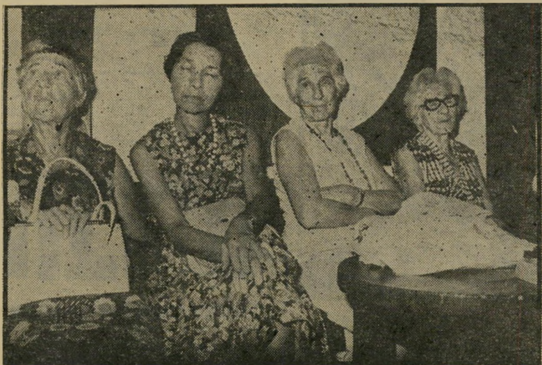
אמו ודודתיו של דנציגר לעשות, לא לגמור

שלא הציג את עצמו בשם, וסיפר שלמד עם דנציגר בתיכון. הוא הביא דינה אחרת מזו המוקבלת על פסל נימרוד: "הפסל החל כנימרוד, פסל לזיכרו של דוד נימרו, בנו של נימרו, מורה-ההתעמלות של הר גימנסיה, שהיה סטודנט למתמטיקה ונהרג בהגנתו של ירושלים ב-1936... הפסל ינק מן האמנות של פרו, שהקסימה את יצחק אז. אני זוכר את יצחק מאז שנת 1929, כיקה טובה, עם כל הרע והטוב שבוה..."