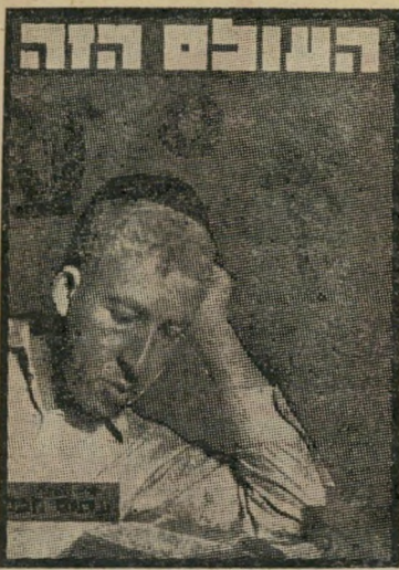
איש השנה תש"ח חַתָּן תְּנַיִן חָכֵם