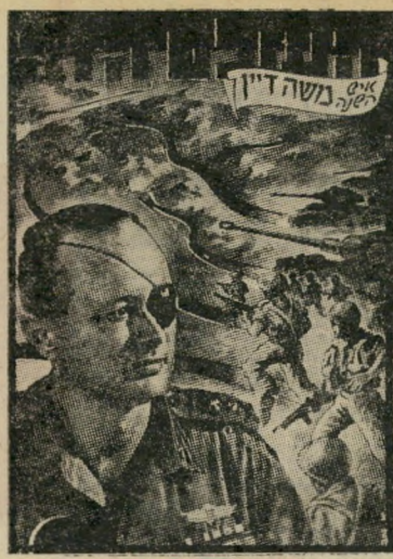
איש השנה תש"ז מַצְבִּיא סִינֵי דִיין