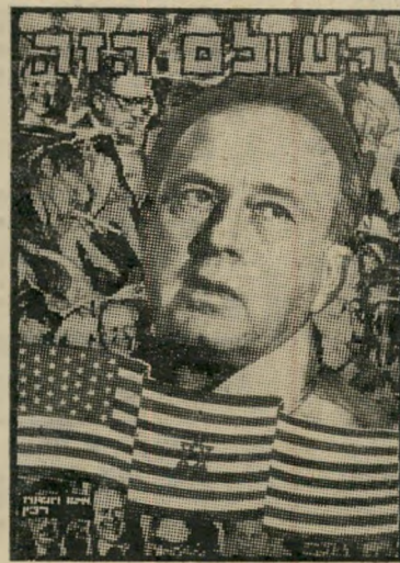
איש השנה תשל"ה רֶאש־מַמְשֵׁלָה רֵבִין