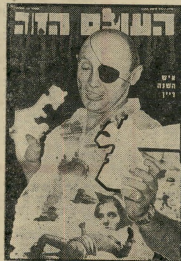
איש השנה תשכ"ז שֶׁרְהֵבִישְׁחֹן דִּין

דגמרי. היא פרי שיקוליהם הכלי כדורים של עורכי "העולם הזה". היא מזווה גם כדרך כלל, כגל של נחושים: האם יהיה אישה-שנה תש"ז רמות מוכרת וידועה, שי בהירתה צפויה ונתונה כמעט מראש? או שמה הוא יבחר מקרב אלה שפעלו רק כדמויות-מושגה עזי הכמה הציבורית, אך מסמלים כדמותם או כמעשיהם יותר מאחרים את מה שאירע בשנה שחלפה? מי שחק הניחושם הזה יכוד להתפתח למושחק חברתי משעי שעי. אפשר אפילו, כפי שאירע בי עבר, לערוך "טוטו אישה-שנה". אבל בשוטם יותר מכל הוא להמי תיו להופעת הנידיון הבא. גידיון ערב ראשה-שנה, שהוא גם גידיון אישה-שנה של "העולם הזה".