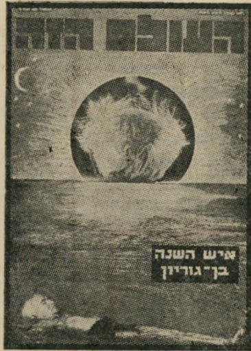
איש השנה תשכ"ג מַתְפַּסֵּר בֶּן-גּוֹרִיּוֹן