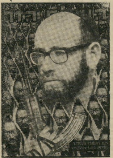
איש השנה תשל"ז מְנַהִיג "גוֹשׁ אֲמוֹנִים" לוֹוִינְגֵר