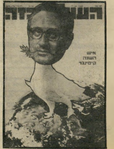
איש השנה תשל"ד מַסְדִּיר־בִּינָיִים קִיסִינְגֵר