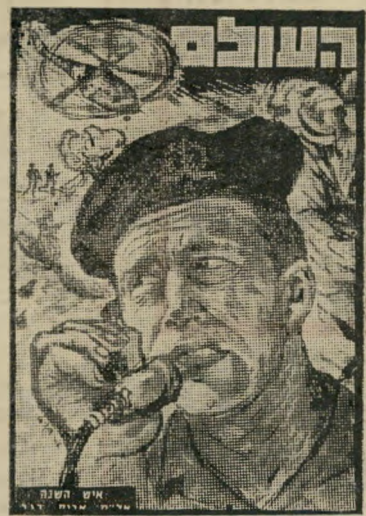
איש השנה תשכ"ח לּוּחַס־בִּפִּידִיּוֹן רֵגֵב