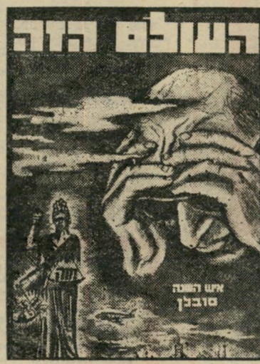
איש השנה תשכ"ב קוֹרְבֵן סוּבְלָן