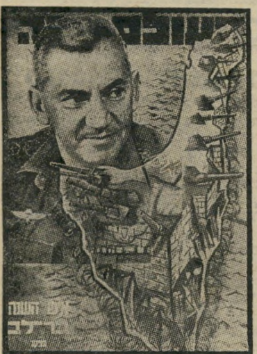
איש השנה תשכ"ט מַפְקֵד מִיבְצֵר־יִשְׂרָאֵל בְּרִילֵב