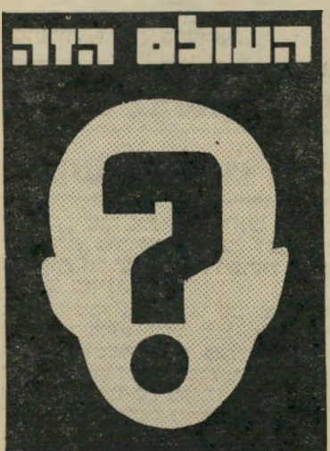
איש השנה תשל"ז