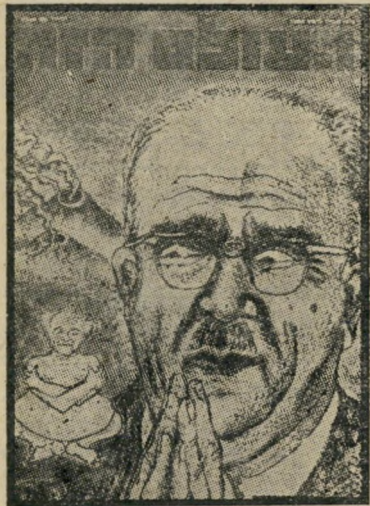
איש השנה תשכ"ד יֹרֵשׁ אֲשְׁכּוֹל