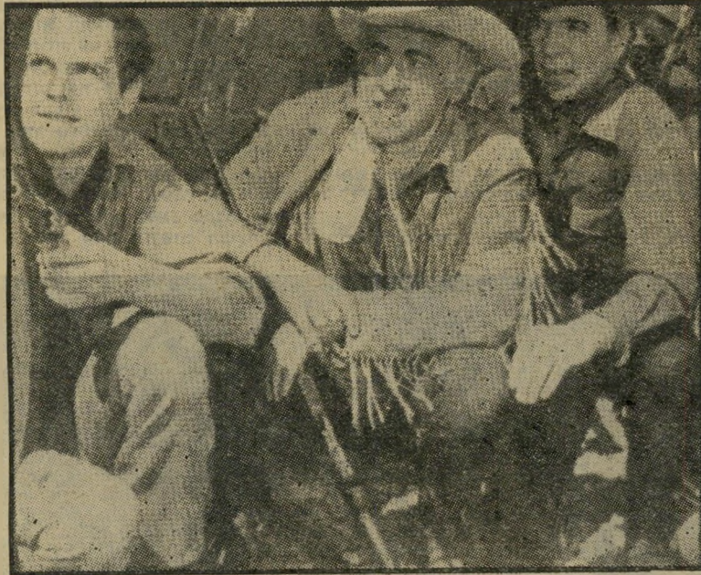
שר-המישטרה (במרכז) השתתף הבוקר במארכ לחיסול חשבוניות שאירגנו אנשי הפשע המאורגן, ועמד על הקשיים שבהימנעות מפגיעה בחפיים מפשע בעת ביי צוע המשימה.