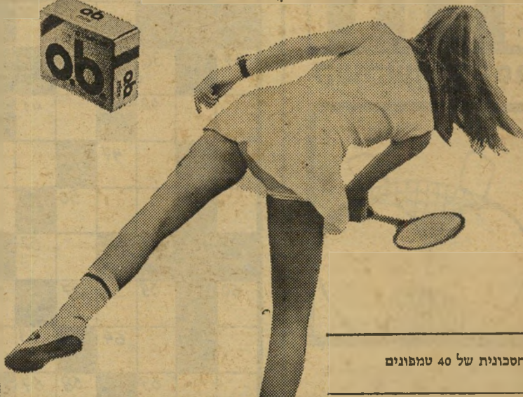
חדש! ארזיה חסכונית של 40 טמפונים

טמפון ארבה, הטמפון הקטן הנוד והבטוח ביותר בעולם נותן לך הרגשה משוחררת וחפשית, 365 ימים בשנה. תוכלי ללבוש מכנסונים קצרים והדוקים, חצאית מיני, או ביקיני. תוכלי לרקוד, לטייל, לטבול באמבט ולרחוץ בים בבטחון מלא. טמפון o.b. קטן משפתון ולכן קל ונוח לשאתו בארנק.