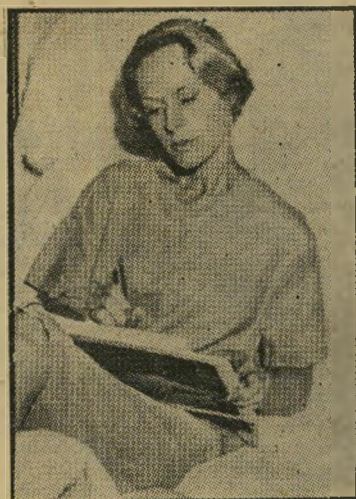
פצועה, טיפי הדרן, במיטה הפיל הכיר אותה —

אבל הצעקה היתה לא רק קולנועית, כי אם מציאותית ביותר. "היה זה הרבה יותר