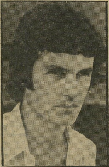
סופר טל-שיר "קצב שלא הכתבת"

כתב עמוס ספר ושייצא לאור. מעבודה לעבודה . מה עבר במהו של השחקן הצעיר כשקיבל את הבשורה. משאת-נפשם של סופרים מתחילים כה רבים? "הכל התרחש באופן מאד לא רומנטי" הוא מתוודה. "לא הייתי חודש ימים ארוכים לתשומתה של ההוצאה. קיי בלתי תשובה תוך כמה ימים, והעניינים התחילו לרוץ. אז התחלתי להתבונן בי עצמי, אספתי זיכרונות והתחלתי לסדר הכל בראש. מובן שכמו כל בן-אדם קטן גוני הייתי מאד שמח, ויחד עם זאת הרגשתי אהריות מסויימת כלפי עצמי. כיוון שכל מה שקרה — קרה בקצב שלא אני הכתבת. הייתי בן-אדם שתמיד ידע שיש לו מה להציע. הנה פיתאים בא משהו ולקה. כל השנים התייחסתי לעצמי בהעדר רכה הנכונה. הייתי מודע לכוח שפועל