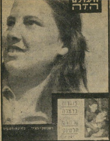
העולם הזה 771 תאריך: 31.7.52