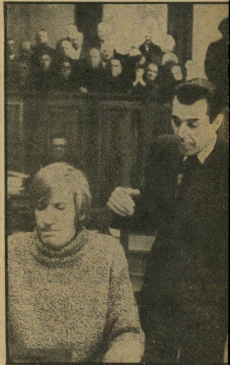
בוגארד מוז וורנר בחלום מאשים הופך לנאשם

לאחר ליל-היסורים באות הדמיות הר מעוותות שבחלומות לבקר אצל הישיש ביום הולדתו ה-78, ואז מתברר סופית שכל מה שקרה עד כאן לא היה אלא פרי ביעותיו של הזקן. זקן שלא הוא בלבד הולך למות, אלא עולמו כולו עומד בסכנה. כסופר ותיק הוא רואה במוות את הפיתוי האמיתי הראשון להאמין במשהו. כמהפכן בעבר, אבל רק במחשבה ולא במעשה («הוא אהב מהפכה אבל לא מהפכנים», אומר עליו בנו). וחי כל חייו כבורגני