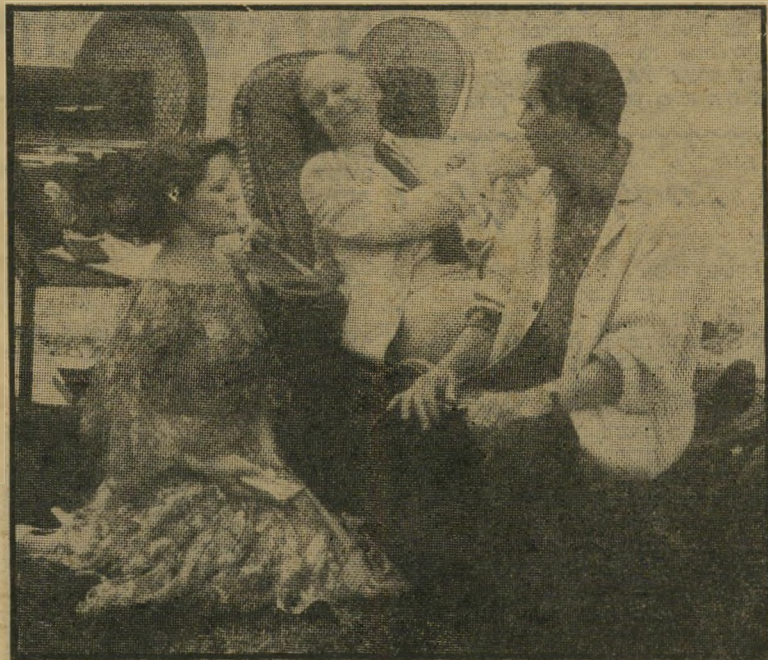
בוגארד גינגוד ובורסטון (האשה החביבה) האם אין לו דגשות?

קשה להצביע על דבר שאינו מעורר התפעלות בסרט זה: החל מתנועות המצלי מה הכיוון שלהן, הגוונים של התיפארה