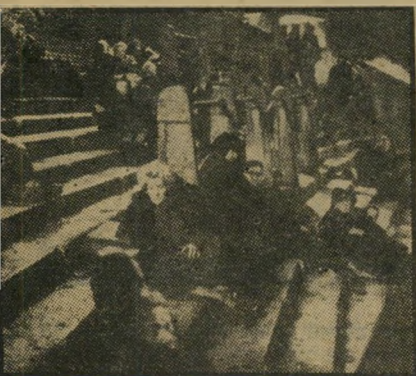
איסוף זקנים להשמדה טיט של פחד המוות

*** הרומן שלי עם אנני (חוף, תליאביב, אורגיל; ירושלים) הברקר תיו המלולולית של וודי אלן משתקפת בתמונות, ומשקפות את תיסכוליו העמר קים של אמן יהודי בעולם המודרני האמריקאי.