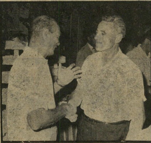
מנמש עם דיין של אנשים חשובים —