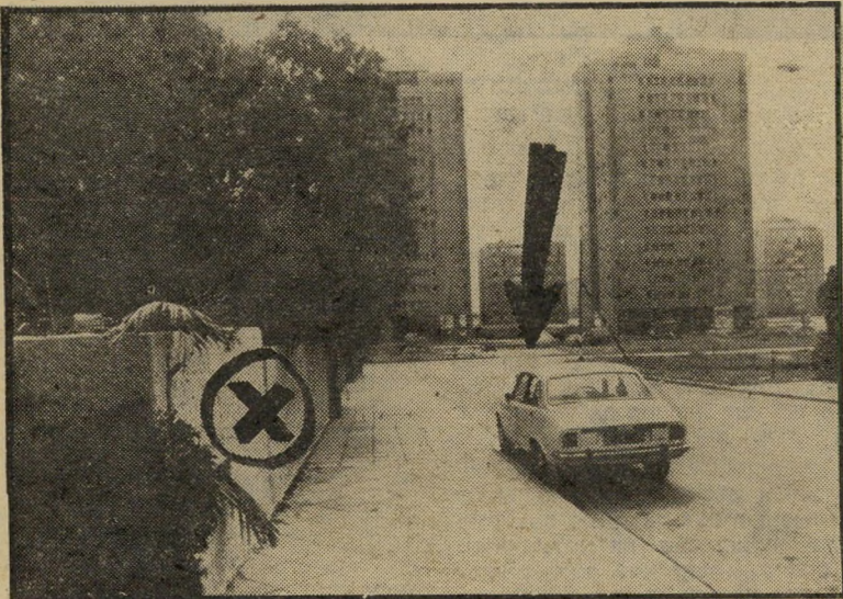
המעבר החסום (מסומן בחץ) אי בית ראשיהעיר * מאחרי גבם של הדיירים

אלה שני מיכנים אימתניים בני 16 קומות כל אחד, יצוקים בטון, אפורים ומזדקרים מעל לנוף הווילת שמסביב.