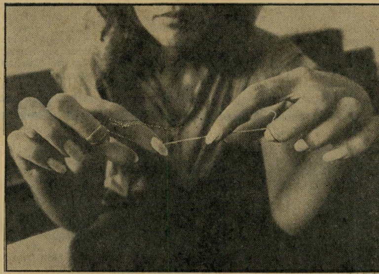
יותר טוב ממיברשת-שיניים

החוט המתאים ביותר הוא זה הקטן, המצולם, המופיע בשני סוגים. סינתטי, במדבקה כחולה, ומשי, במדבקה אדומה. כדאי להעדיף מכל בכל את המשי, שכן הסינתטי לא גמיש ופוצע. רצוי להחזיק מיכל אחד ליד המיטה, אחד באמבטיה, ואחד בארוך הקטן ההולך עם בעליו לכל מקום. האיטנטיסטים יצעקו אולי המם, אבל זה פראקטי.