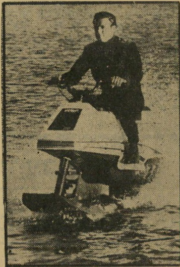
007 על אופנוע מתוחכם דהר ופנע!

הזיקנה מאיימת. ארבעת הגברים שי סביבם נרקם הסיפור שייכים כולם למה שנהוג לכנות "בורגנות הרווחה". האחד פקיד בכיר, השני דורסא, השלישי מוכר מכוניות-ספר משומשות — בכל אופן, אין לתם צורך לדאוג לפרנסת יום המחרת. כולם בסביבות גיל 40-45 והמירוץ אחר המעמד, המאפיין את העשור השלישי בי חייו של אדם, פנינה את מקומו למנוסה מפני הוויקנה, המאיימת על העשור הרביעי. כל אחד מהם צריך בעצם להיות מאושר