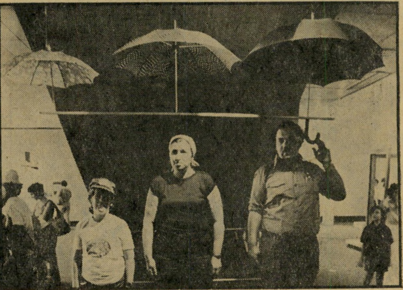
מיטריה דמ המישפחה כולם יחד מתחת