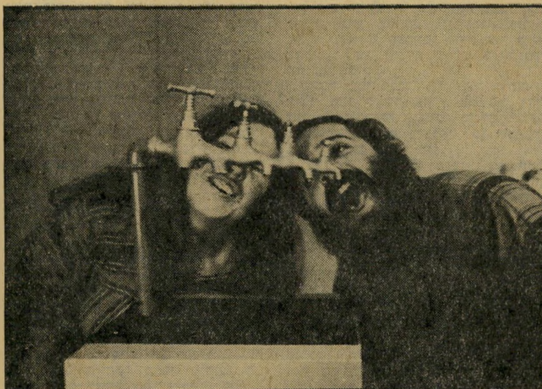
ברו קודקטיבי לרחיצה בטוחה