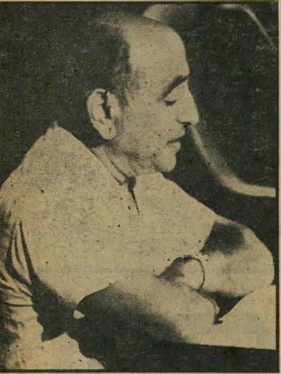
ראש-המוסד לשעבר הראל להדום!

רק כעבור שנתיים נכתב דו"ח על הפרשה, ובו ניסו מפקחי הוועדה האמריקאית לאנגריה אטומית למצוא הסברים להיעלמות האורניום ממחסני המפעל, אך לא שוכן ליד העיר אפולו בפנסילבניה. תהסי בר המתקבל ביותר על הדעת, לטענת הי