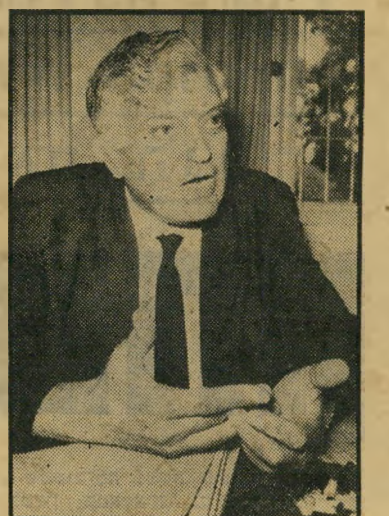
שופט-שולם בוכוויץ טען: לפגם

בתקופה בה נעלם האורניום שימש איסר הראל כראש המוסד וכממונה על שירותי הביון והמדיעין של מדינת-ישראל. כאשר נשאל איסר הראל השבוע לתגובתו על הפירסומים בעיתונות האמריקאית בדבר החשדות שהועלו, כאילו ישראל מעורבת בגניבת האורניום בארצות-הברית, הגיב: "בתקופת כהונתי עד 1963, לא היה שום דבר כזה. לא היתה שום פנייה של האף-בי-איי כדי לקבל מידע בנושא זה. בזמני לא ייתכן כלל שהיה חבר כזה." הראל חקירת האף-בי-איי החלה רק בי שנת 1966, שלוש שנים אחרי שאיסר הראל פרש מתפקידו.