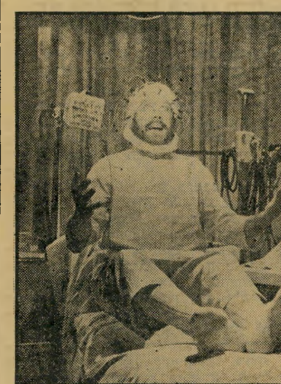
גאסטונה מושין כמילאנדר החליטים מן הנעורים

חופשה צוענית. החופשה הצוענית יכולה להישמק יממה אחת או חודש תמים, היא יכולה להיות מעשה-קונדס אחד — כמו הטחת סטירת-לחי בפני כל מי שמעז להוציא את ראשו מן החלון — של רכבת כשהיא יוצאת מן התחנה — או אחיות-יעינים מורכבת ומתמשכת, כמו המתחיה שמכניסם לפנסיונר גולן וולן בשם ריגי (שאותו מחק הפליא ברנארד בלייה) שלפניו הם מציגים את עצמם כי