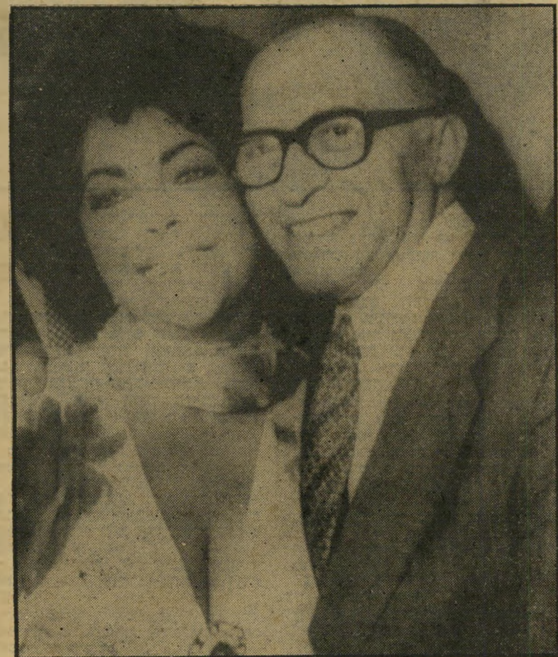
בגין עם אליזבת טיילור בניו-יורק, מי פוחד מפני היהודים?

כל אותה עת לא שכח בגין אף לרגע את בסיס-הכוח שלו — דעת- הקהל הישראלית. כפוליטיקאי אמיתי, ידע כי כוחו בחוץ תלוי בכוחו מבית.