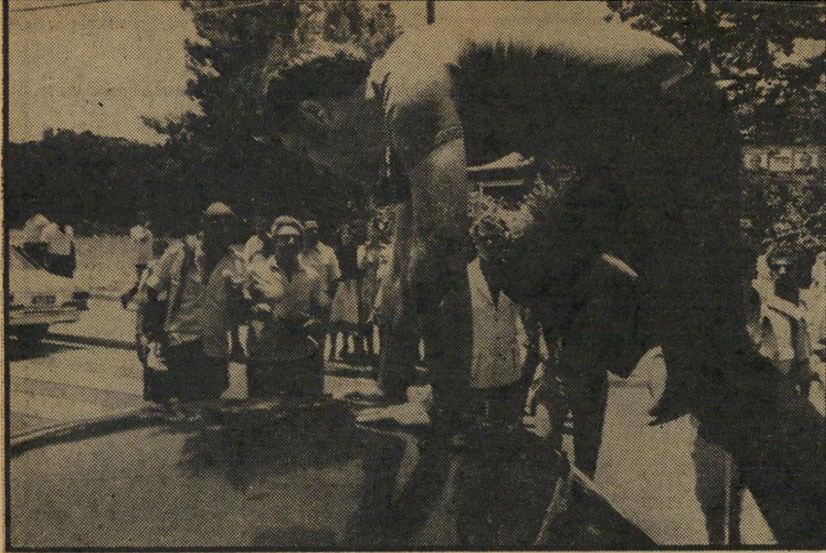
— מטפס על גג המכונית — טיפוס אלים