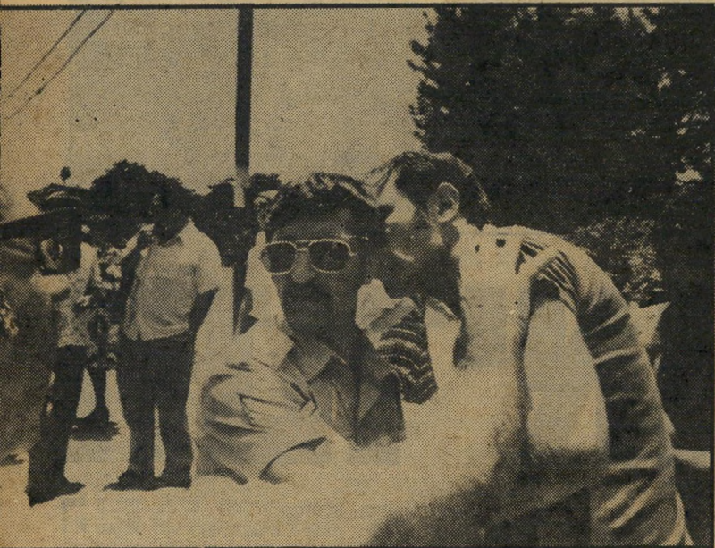
— מזדה בעיני שופר שניסה לעצור — שופר — אבל לא במדים