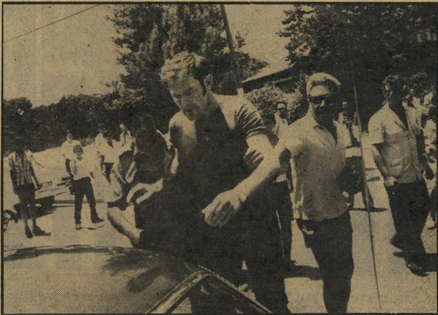
— כועס בפני הנחג שבמכונית — ככה ייעשה לאיש