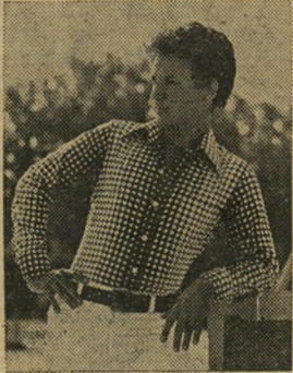
חולצת בדגרה בהדפס עיגולים

ערב פתיחת שבוע הפלש ה" שנת, המהווה מעמד ראוה של מיטב יצרני האופנה ביש" ראלי, ערכנו ביקור ב"לורד" - יצרן אופנת חולצות העיר לית לגברים. בהזיתנו במח