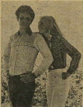
גם על הנשים חשבו בלורד.