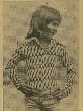
חולצת טריג - ילד, ילדה מודפס בצבעים שונים.

פר מצומצם של דגמי יוניסקס אקסקלוסיביים, למיוחדות בל" בד.