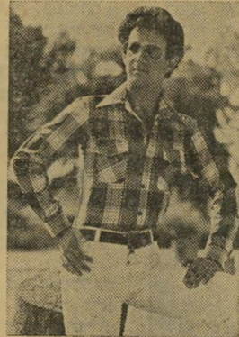
חולצת משבצת - יוניסקס.