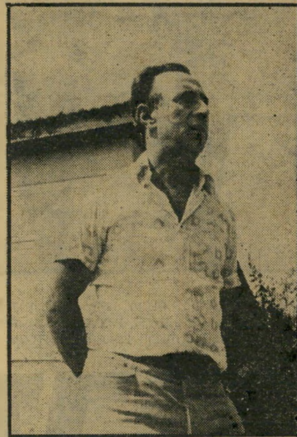
ראש-חמולה זכו רחמים - נגד המפכ"ל

„מהסברו של ראש לישכת-החקירות ב-מישטרת ישראל-הנגב, נובע כי בניגוד להוראות שקיבל הודיע התובע לבית-המשפט ביום 10.2.74, כי הוא חוזר בו מן האישום, וכתביה-אישום בוטל, מאחר והסגירה היתה, כאמור, בניגוד להוראות, נצטווה התובע לחדש את כתביה-אישום, אולם בישיבת בית-המשפט מיום 2.6.74 טען סניגורם של הנאשמים כי הנאשמים כפרו באשמה בכתב כטרם בוטל כתב-האישום, שכן באיכותם שלה לבית-הדין פט מיכתב שבו הודיע על כפירת הנאשמים באישום. בית-המשפט קיבל טענה זו של הסניגור, וקבע כי משחזר בו התובע מן האישום במסיבות האמורות, חלה הסתייגות של סעיף 84 לסדר-הדין הפלילי, ויש לזכות את הנאשמים. „מאחר שלצערנו חלף בינתיים המועד להגשת עירורו על החלטתו זו של בית-המשפט, שלחתי את החומר אל פרקליט מחוז הדרום, על-מנת שישקול בקשה לה-ארכת המועד להגשת העירורו.”