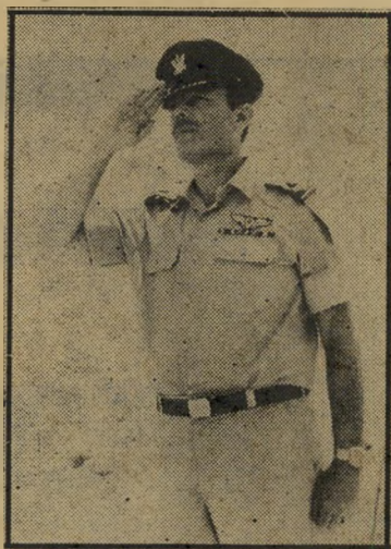
מפקד פדר החיים פטורים

כך מעורבים במילחמת-השבת ברחוב השומר לא רק הפוליטיקאי הממולה, ש נתמנה זה עתה ליו"ר ועדת-הכספים של הכנסת, בעיקבות הקנונייה הקואליציונית