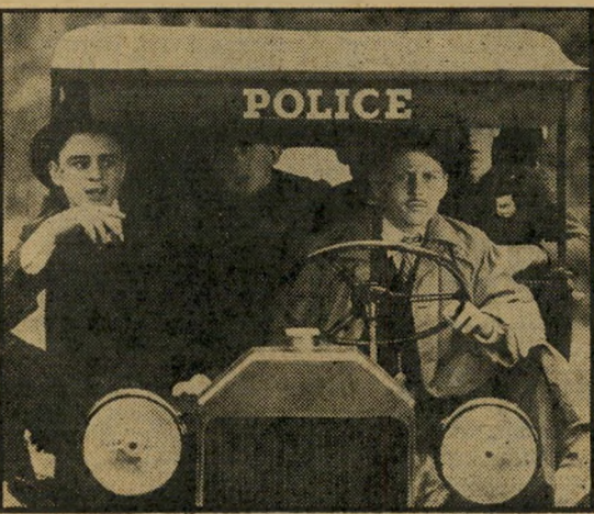
ילדים במכונית גנגסטרים — עוגות ופדאלים

האשה המאוכזבת. האשה הנשואה בסרט, היא סמל האשה המאוכזבת. היא היתה פעם צעירה ויפה, וצעיר חסון וגבר-תן ניראה לה ערובה לחיים נפלאים. אבל זה שקר. היא היתה יפה, הוא היה נאה — זה הכל. אתרייך, ריקנות. והנה העתיד הצפוי גם לשתי הנשים האחרות. הנערה הבוגרת יותר, המנסה להתנהג כפי המקור-בל, לדבר לפי האופנה ולהיאחו בדימיון כשהמציאות לוקה בחסר, מתקרבת כבר למצבה של האשה הנשואה. ואילו הנערה הצעירה יותר, המתקנאת כלייך באישיות בכירתה עד שהיא שואלת אותה לעצמה. עתידה בסופו של דבר להגיע גם היא לאותו סוף של הדרך. ומשום כך, אם מקשיבים היטב לדבריו של אלטמן, המ' דובר בעצם באשה אחת ויחידה, בשלושה גילגולים שונים.