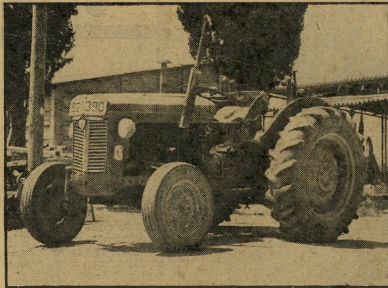
לטרקטור שהרג את הילד לא היה רישיון אך המישטרה בדקה טרקטור אחר, וסגרה את התיק