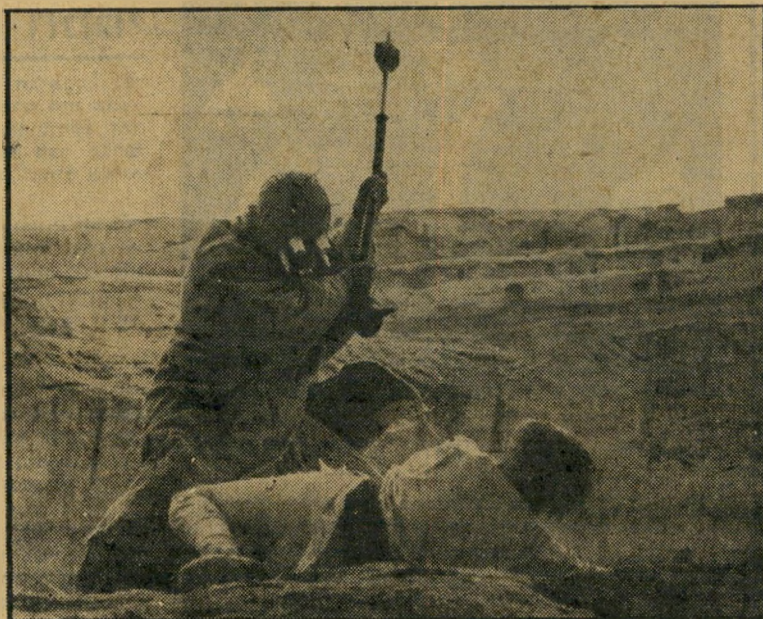
היצור הרע תוקף את הגיבור אגדה נצחית בחלל

הסרט נפתח בשיחה בין שני הרובוטים, המהלכים בנחת על-פני כוכב בשם טאי טואין, שתכונותיו הפיזיות הותאמו לי הפליא לנוף המדברי של דרום טוניס, על גבול הסהרה. לוקאס צילם שם את (המשך בעמוד 46)