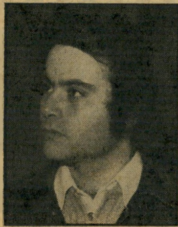
במאי ייעוד לבנון נבואת העם

מ זה כמה שנים קיימת בעולם השקפה הגורסת שקולנוע לא נועד לשעשע, לבדר או אפילו להגיש יצירות מופת מגובשות, הקולנוע, ככל אמנות אחרת, הוא חלק מן המאבק החברתי המתמיד, ותורמתו נמדדת במידת גיוסו למאבק זה. אומנם, כשהמדובר בקולנוע ישראלי זה נשמע רחוק ודימיוני למדי, אבל הגה, מסתבר שיש גם בארץ סוג כזה של קולנוע מיליטנטי מגויס. הדוגמה לכך היא סרט כבן שעה בשם