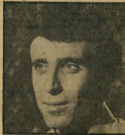
שחקן רגב חי קיים בניו-יורק

אבנר שימש גם כפרטנר לשחקנים ישראליים שבאו ללמוד מישחק בניו-יורק.