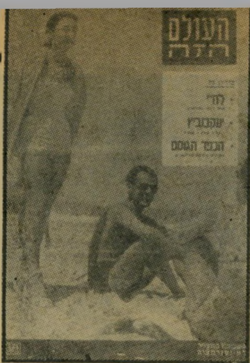
העולם הזה 764 תאריך: 19.6.52