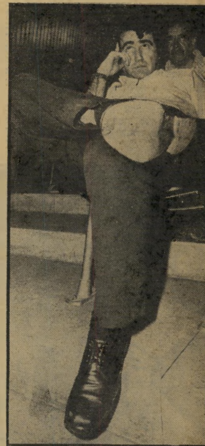
שר-התינוך המר הרב לעג לתלמידו

לחם ושעשעוטיב. לא היה ספק: זאת תהיה ממשלה שלא רק תשלוט, אלא תר" אה שיהא שולטת. בכל האמצעים שבידה. הדראמה, המלל, הג'סטות, מחזות-הראווה המבריקים שכליך חסרו בממשלות האחר