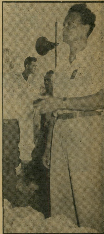
אלון בכנס הפלמ"ח (1951)

קשה לצעיר של 1977 לתאר לעצמו מה היה יגאל פייקוביץ בימי זוהרו, דור אחד קודם-לכן. הוא היה האליל של דור הי