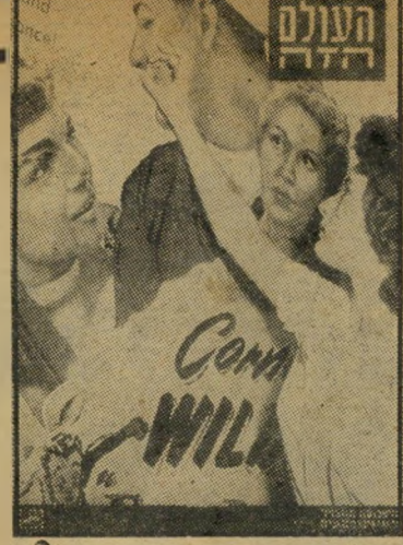
„העולם הזה“ תאריך: 12.6.52

רפואי חדש במערב ירושלים, על רקע נוף מרהיב-עין.