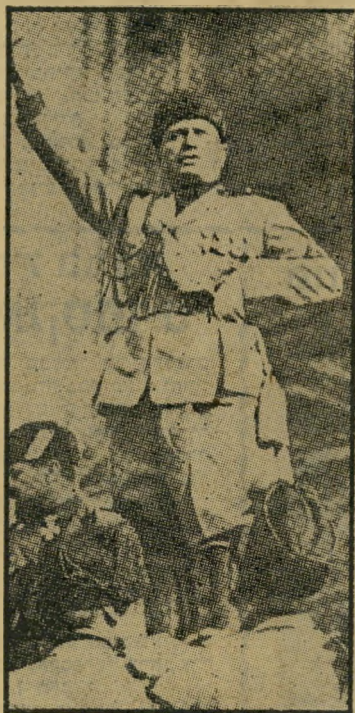
בניטו מוסוליני אהדת בית"ר

מאמריו של אורי אבנרי על "ימי ויימאר האחרונים" (העולם הזה 2074) ו"מהסכה בקרוני-רכבת" (העולם הזה 2075) היו מלאכת-מחשבת של כתיבה בין השורות. המסקנה העיקרית שלו — שהליברלים בגרמניה ובאיטליה ביצעו, מרוב פחדנות וקוצר-ראייה — פשע היסטורי, מעוררת למחשבה. אני מציע שהמערכת תשלח