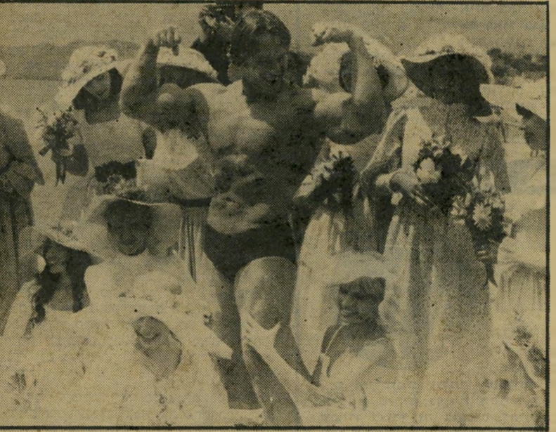
מנפח-שרירים ארנולד שוורצנאגר "מי שאוכל זבל נראה כפחזבל"