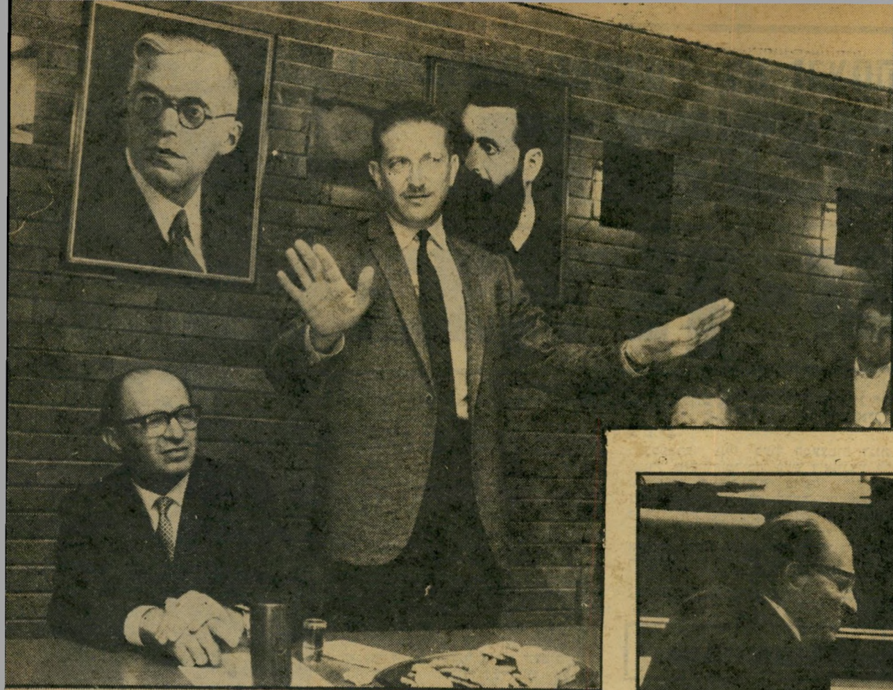
בגין עם וייצמן פרט לאדריכל-הניצחון

יתר-על-כן: עזר וייצמן היה מעדיף שי אריק יורחק לחלוטין מכל עיסוק בענייני ביטחון. היה זה הוא שהציע להעניק ל-אריק את תפקיד שר-החקלאות. בגין דחה את הרעיון על הסף. הוא הבהיר שהוא רוצה לראות את אריק קשור בענייני הביטחון ולאור הנסיבות שנוצרו, במיסגרת מוגדרת, הרחק משרד-הביטחון. בתוך