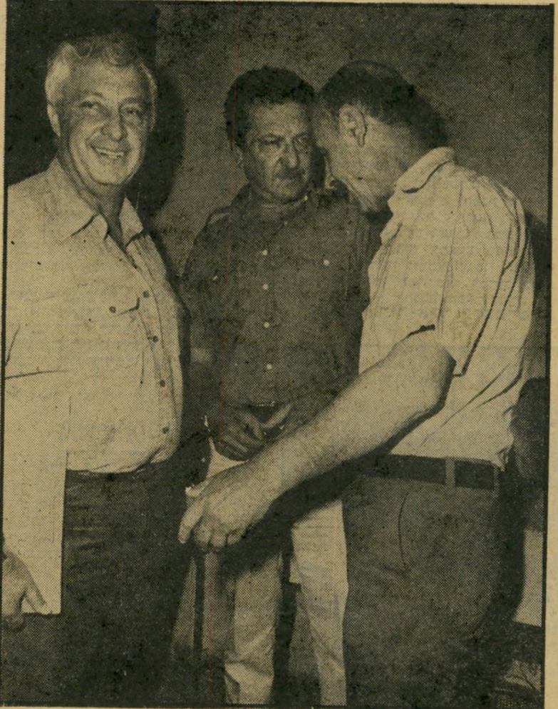
דיין עם וייצמן ואריק נגד האוייב המשותף

ייתכן שהאיום שמהווה דיין בתוך ממשלה לת מנחם בגין, הן לגבי וייצמן והן לגבי שרון, הוא שימנע פריצת מאבק ביניהם, ויביא אותם לכרות ברית של שיתוף-פעולה לה נגדו.