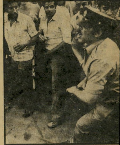
„עוף!“ צועק שוטר מעוצבן ל־ עבר מפגינן, איש הליו־ כוד, שניסה לחדור לתוך שורות המפגינים נגד משה דיין ולעורר שם תיגרה.