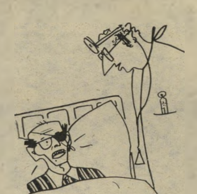
"עכשיו אני רואה כמה אתה חזקה..."