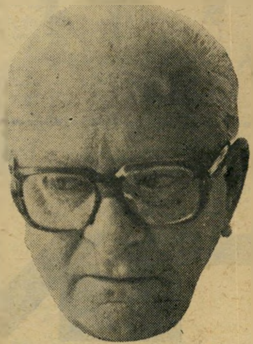
ח"כ ארדיך מה שטוב