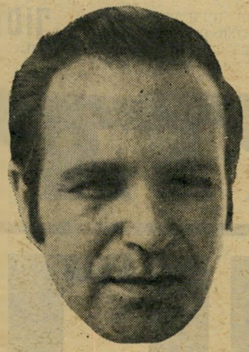
ח"כ פת טוב גם