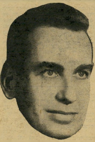
ח"כ שיכר למדינה כולה

וויצמן כתב לברק כי הוא בעל עניין במיספר חברות ועסקים הקשורים ב"מערכת הביטחון. עתה, עם כניסתו לתפקיד שר-הביטחון, הוא מבקש הנחיות כיצד לנהוג בעסקיו הפרטיים, והוא מתחייב לקיים כל המלצה של ברק.