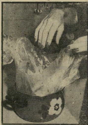
לקראת ההכנה לשמור על הידיים

כשאני לא עוסקת בחיבור הסימפוניות הבלתי-גמורות שלי (אני אלופה בלהתחיל דברגם שסיומם נדחה לזמן בלתי-מוגבל. הדבר נותן לי הרגשה נהדרת. כאשר ייגמר רן לי הרעיונות החדשים — תמיד אוכל