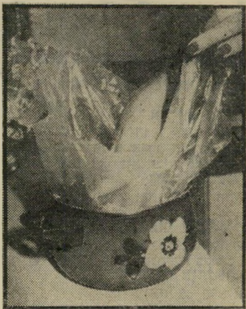
הלישה יד עושה במלאכה