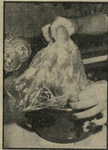
סוף התהליך הידיים עדיין נקיות

למשל: כאשר יש לערבב עיסה כבדה (בצק, סלט כלשהו בכמות גדולה, עיסה של עוגיות-פונז וכו'), ולא רוצים ללכלך את היש, מערבבים בתוך סיר גדול. אבל — לערבב בעזרת כף קשה, הכף לעיתים מתעקמת. לערבב בידיים לא נעים — למרות שמאד נוח. העיסה נכנסת מתחת לציפורניים, וזה לא אסתטי ולא היגייני. ללבוש כפפות לא נוח, צילצולי-טלפון פית-