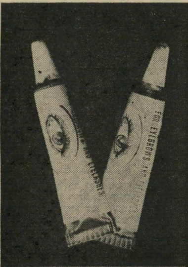
חומר-הצביעה שחור וכחול

לא לעצום עיניים בחזקה! יש לעצום אותן רפוי וטיבעי. עצימת עיניים בכוח סוחבת את הריסים פנימה לתוך העין, וי בהכרח גם את החומר המשוח עליהם. במידה שצורב, יש לשתוף את העיניים. ולבקש מהעולם — במחילה מכבודו — לאהוב אותך ככה. כמו שאת.