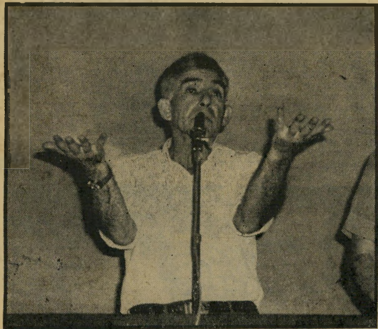
מזכ"ל מתפטר זרמי עדיין מוקדם להבין

ישראל גלילי , שר-בליתיק: "אינני זריו כל-כך. עדיין לא הספקתי לנתח. אני נגד ממשלת ליכוד." יגאל אהן , סגן-ראש-הממשלה ושר-