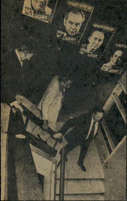
המיליונרים של ד"ש העכברים השמנים בראש

הדתי, שגדל מאז בתחמדה. הוא מסר גם את הזרם ה"כללי" בידי הלאומנות הדתית שלוחת-ההרסן, שהתחבאה מאחורי המושג התמים "תודעה יהודית". "מעשה קיומים במדינה, מזה קרוב ל-30 שנה, שני זרמים דתיים נכתיים: הזרם הממלכתי-יהודי הקיצוני והזרם הממלכתי-יהודי הכללי.