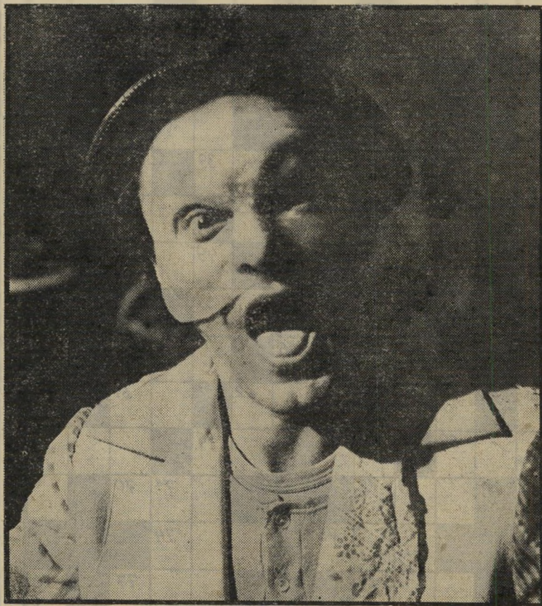
אשר צרפתי במחזה „קספר“

כלומר: הצגה שזכתה בביקורות מהמעותיות בעונת התיאטרון הנוכחית, המחזיקה את עצמה בתל-אביב באופן עצמאי וממלאת אולמות מזה ארבעה חודשים, בעיירות נידודות להגיע ולהציג בכל מקום במדינת-ישראל, ולמלא את מסקנותיה של ועדת לוינסקי, אינה זוכה בעידוד המינורי מלי שבו זוכים תיאטראות הבורקאס הירושלמי והמסובסדים. כך נוצר מצב שבו תושבי ישראל האחרת אינם זוכים בהצגות התיאטרון האחר.