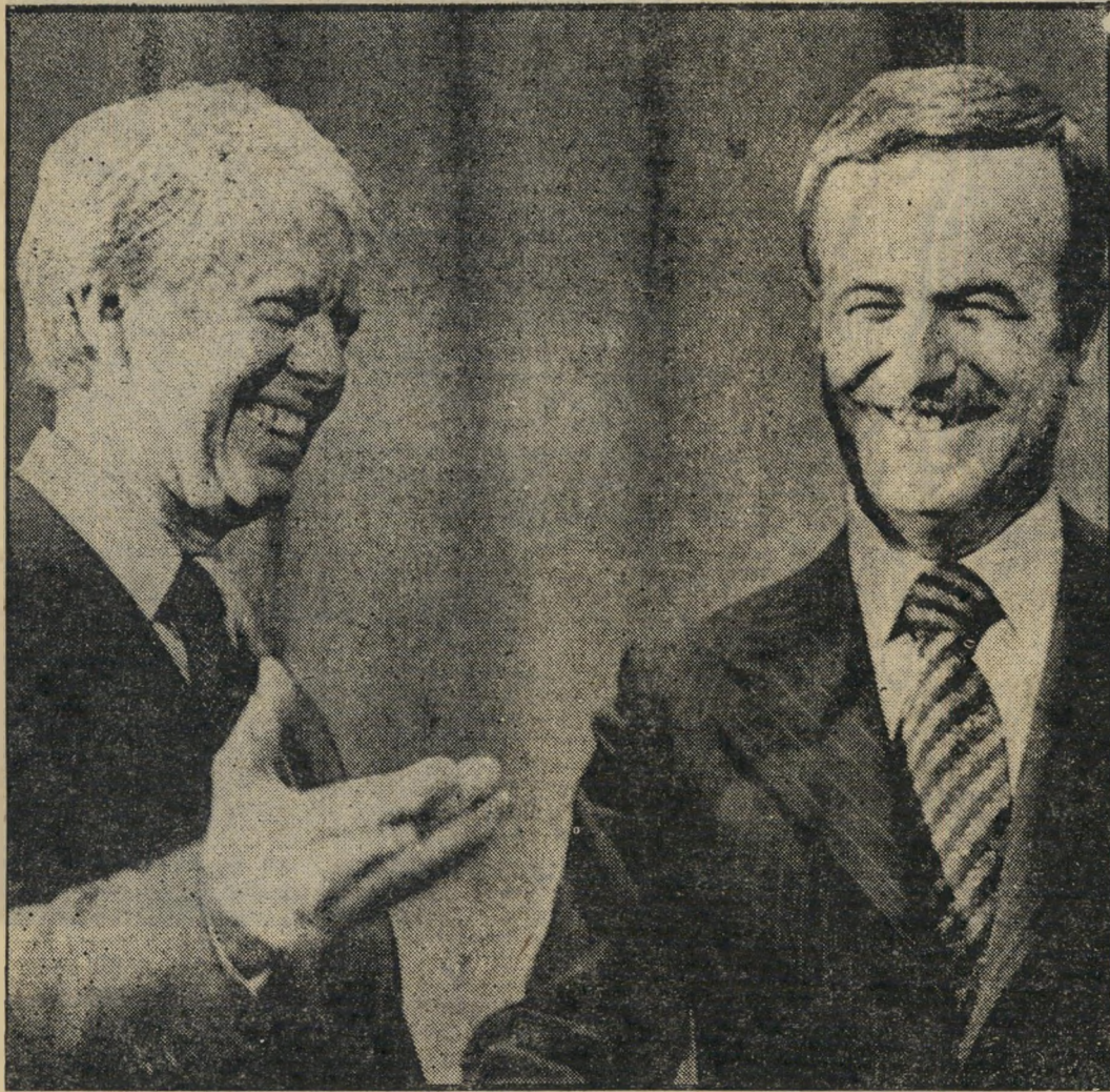
חאפז אל-אסד עם ג'ימי קארטר בז'נבה: על חשבון מי?

הוא אמר כי בקרוב ייצא שריחוקו שלו למסע נוסף