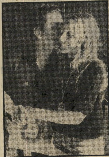
שייטת לוי * צריך לוותר