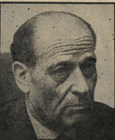
רימלט נשיא המדינה