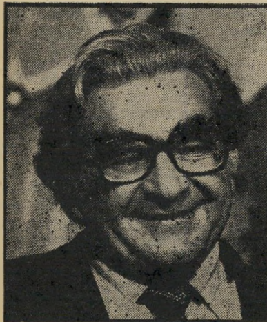
דולצ'ין יו"ר הנחלת הסוכנות

התיכנית המתגבשת והולכת מאח-רי ריי-הקלעים מיועדת לכונן בפעם הרא-שונה בתולדות מדינת-ישראל ממשלה ש"תהיה מושתתת על קולותיהם של שתי המיפלגות הגדולות. אין הכוונה, כפי שני-