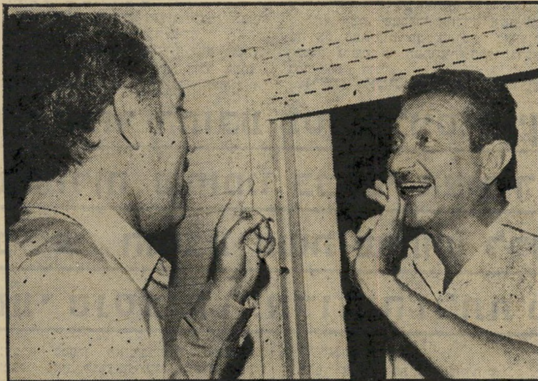
מנהיג המשא-והמתן: עזר וייצמן וגד יעקובי יד רוחצת יד

חוק מזה, הסביר אחד מאנשי מחנה פרס, "כאשר ניאלץ להתיצב בפני הבריי רה להיות באופוזיציה או בשילטון יחד עם הליכוד, מעטים מאד יהיו מוכנים לבחור באפשרות הראשונה."