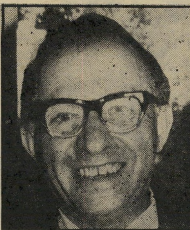
בגין סגן-ראש-הממשלה ושר-החן