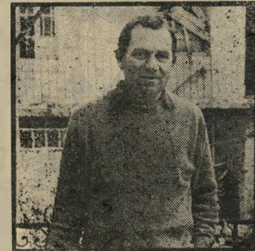
יהודה עמיחי שיכחה תמונה

מזה שנים אחדות ניתן למצוא מדי יום ישי, באחד או בכמה ממוספיה-הסיפורות של העיתונות היומית, המחשות ידענותו של ידען צעיר בשם יורם ברונובסקי. בין הפגנת ידענות אחת לרעותה טורה ברונובסקי לעורר את קינאת קוראיו, בתרגומי שירה מאלף לשון ולשון - עד שהיה מי שאמר עליו, כי הלשונות שמהן טרם זכה לתרגם שירה, הן הלשונות המחשבים של י.ב.מ. ואן,טי.אר.