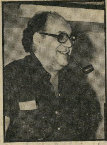
זוכה הכהן - אבל בטוח

עם "אולפני-ההסרטה" ולקבל מחצית מן המגיע לו, ובילבד שקיבל משהו! האם יפעל עתה מרכז-ההשקעות להשגת הכספים המגיעים להכהן?