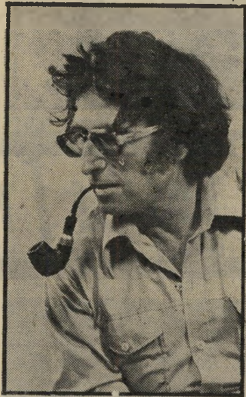
פסל קניספל הפלח ואדמתו

פניותיו הרבות למינהל-מרקע-ישראל, למישרד-השיכון, למישרד-הפנים, להכ"ם, למבקר-המדינה, למדורים בעיתונות הירמית, למישרד, נתקלים בתגובה מזורה, הטוענת לחשש של סתירה בין גירסת