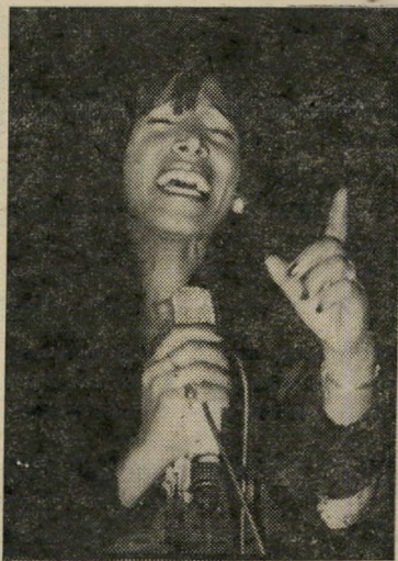
מרים צעירי קאריירה בהולנד

מדבר סחם באוויר הוא לקח אותה אליו הביתה ושם, על מיטתו, היו מונחים כל קיטעי העיתונות שנכתבו על אודותיה ב- משך תקופה ארוכה. הבחור פשוט עקב במסירות אחר הקאריירה שלה.