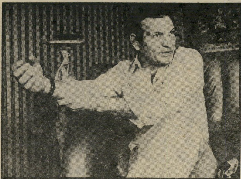
שייקה אופיר שינוי בסטאטוס

מי שמתכוון להיות סוף-סוף סבא הוא השחקן הפופולרי שייקה אופיר. ומי שמכיר את שייקה יודע שאין היום, בכל עולם הבידור המבדר שלנו, בואדס יותר נרגש ממנו. הוא כל-כך מבוסס מהעניין, עד שבמסיבות-הסיום של הסרט הרשלה הוא הרביץ כזאת הופעה ספונטנית, ש- אפילו ספונטניוס בעצמו לא היה מתבייש בה.