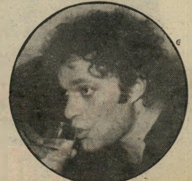
אשר צרפתי בחור רציני

לא שהוא נפגע מהסיפור, אלא שלדבריו, האמא של מלי לא קיבלה את הדברים באותה רוח שבה התכוונתי למסור אותם.