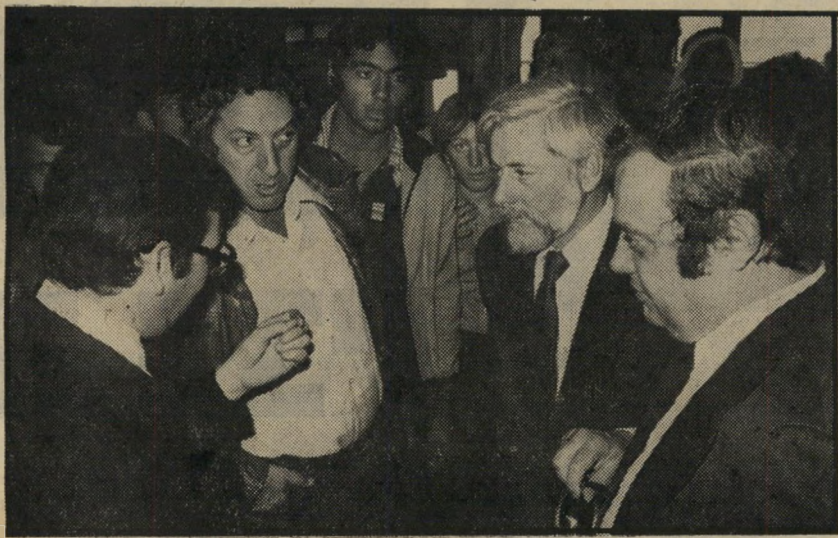
זיכרונות, אבנרי, לכתב וגורדנברג בכיתה-המישפט ולא חקר האמת