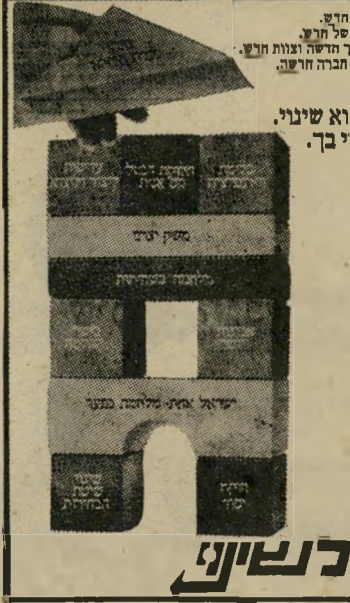
המודעה של ד"ש שינוי -