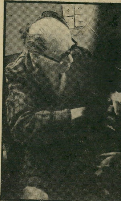
בגין בבית-החולים מידע ממקור ראשון

גם הימין וגם השמאל בארץ ניסו להפיק תועלת ממותו של ראשד כעת. הימין התחיל להתקף את הממשלה, בזה שהרי